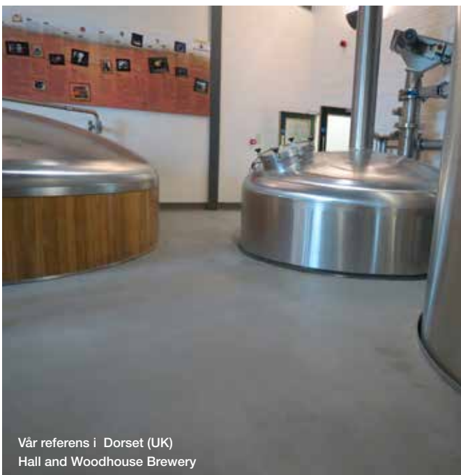
Vår referens i Dorset (UK) Hall and Woodhouse Brewery

Golven i ett bryggeri måste vara tillförlitliga: säkra och hygieniska. Avbrottsstiden för produktionen inom bryggeriindustrin är kostsam och därför är det viktigt att hitta lösningar som minskar behovet av underhåll. Vi rekommenderar därför Ucrete som, globalt sett inom bryggeriindustrin, är ett av de golvsystemen som har bredast användning.