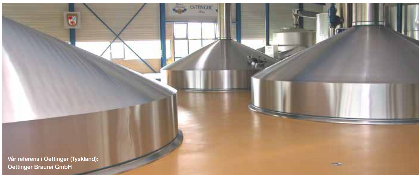
Vår referens i Oettinger (Tyskland): Oettinger Brauerei GmbH