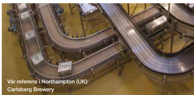
Vår referens i Northampton (UK): Carlsberg Brewery

Kraven på varje enskilt golv skiljer sig från fall till fall. Kontakta våra Master Builders Solutions-golvspecialister för rådgivning.