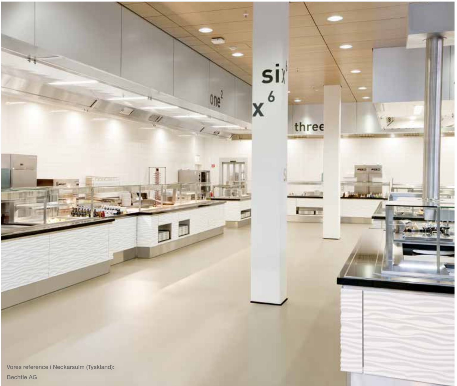
Vores reference i Neckarsulm (Tyskland): Bechtle AG