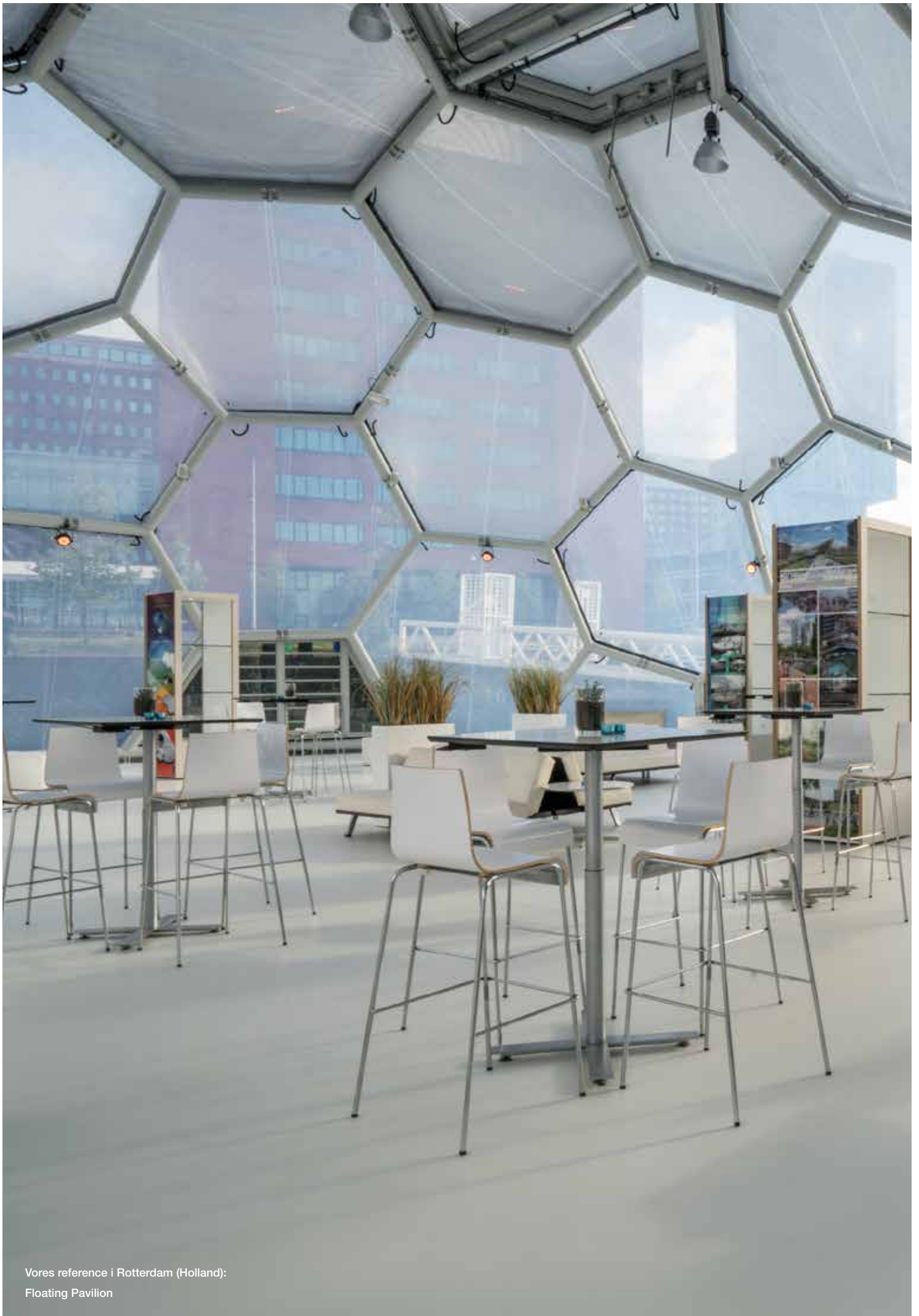
Vores reference i Rotterdam (Holland): Floating Pavilion