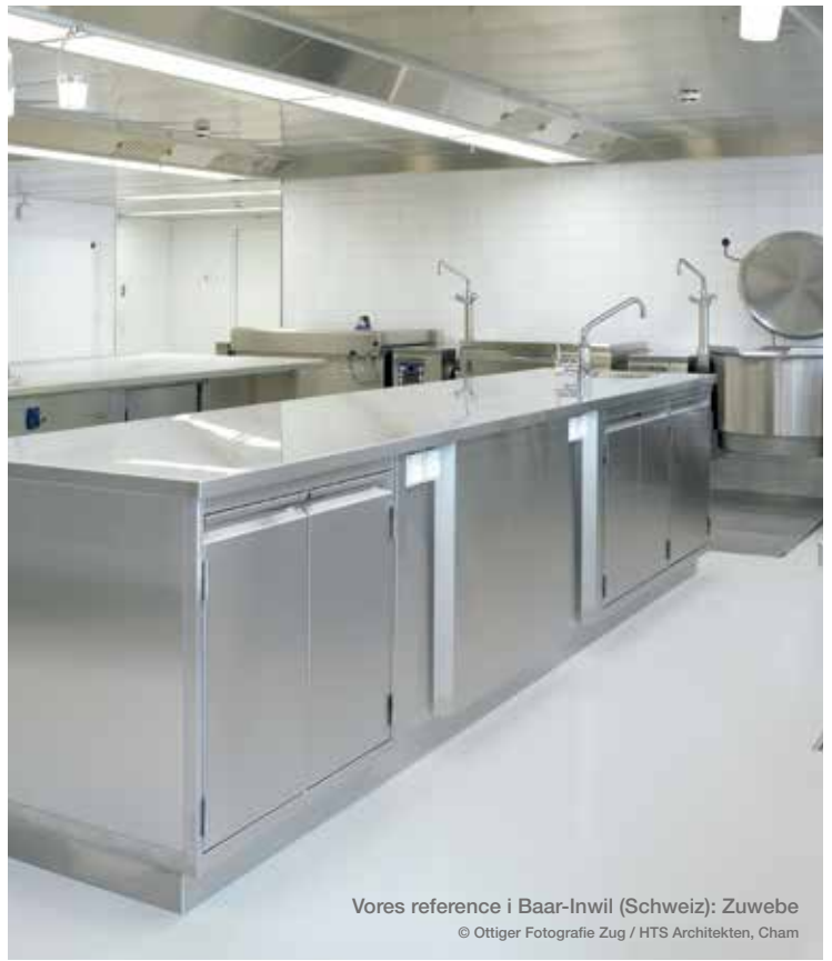
Vores reference i Baar-Inwil (Schweiz): Zuwebe © Ottiger Fotografie Zug / HTS Architekten, Cham