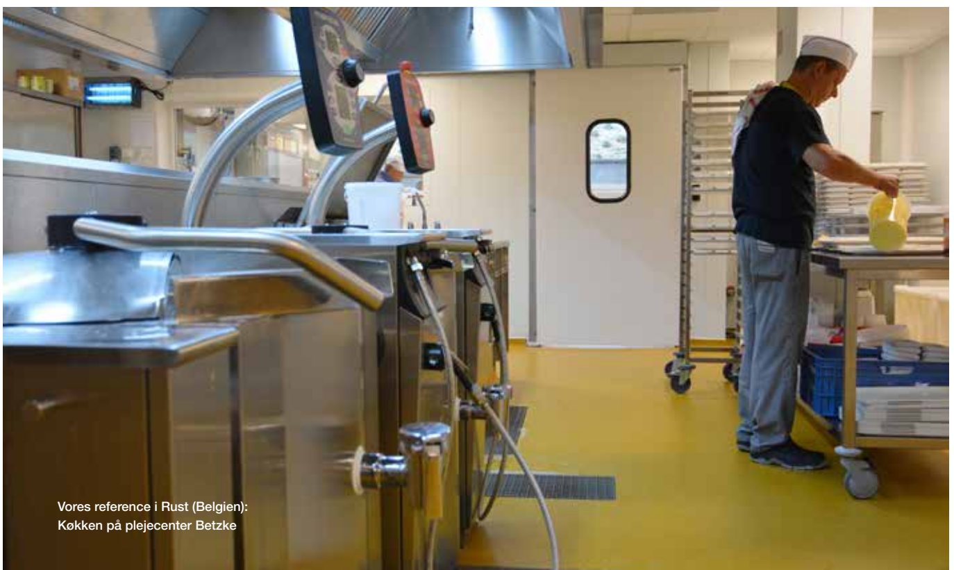
Vores reference i Rust (Belgien): Køkken på plejecenter Betzke

Ucrete gulve blev oprindeligt udviklet til at møde krav i industrien. Derfor er de utroligt slidstærke, med høj slagstyrke og kan holde til at der fx tabes tunge gryder. Samtidig har de høj kemisk resistens og tåler citronsyre, eddike, sukker og lignende. Ucrete gulve kan også anvendes i køle- og fryserum, idet de tåler helt ned til -40°C.