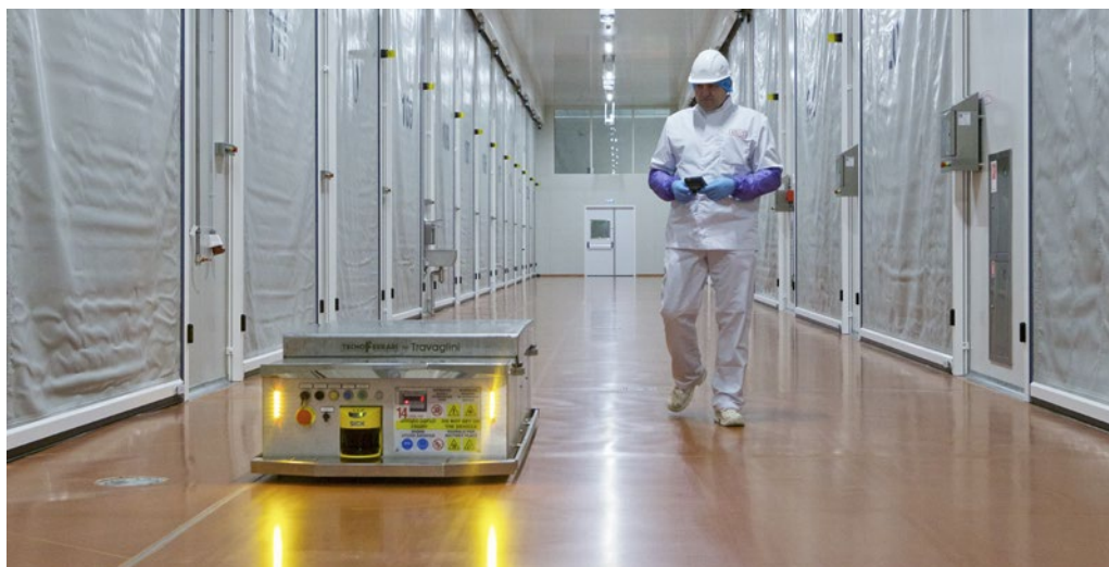
Объект Завод по производству сырокопченых колбас «Черкизово»