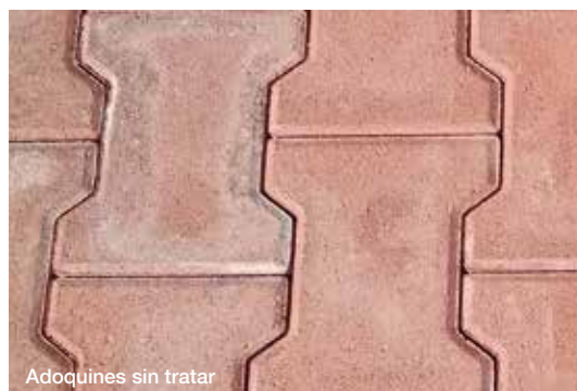
Adoquines sin tratar