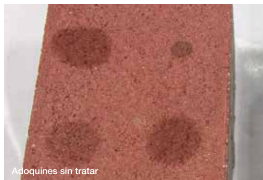
Adoquines sin tratar