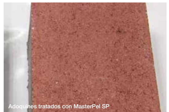
Adoquines tratados con MasterPel SP