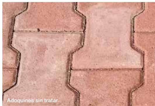
Adoquines sin tratar