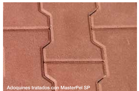
Adoquines tratados con MasterPel SP