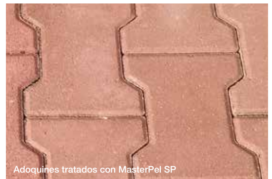
Adoquines tratados con MasterPel SP