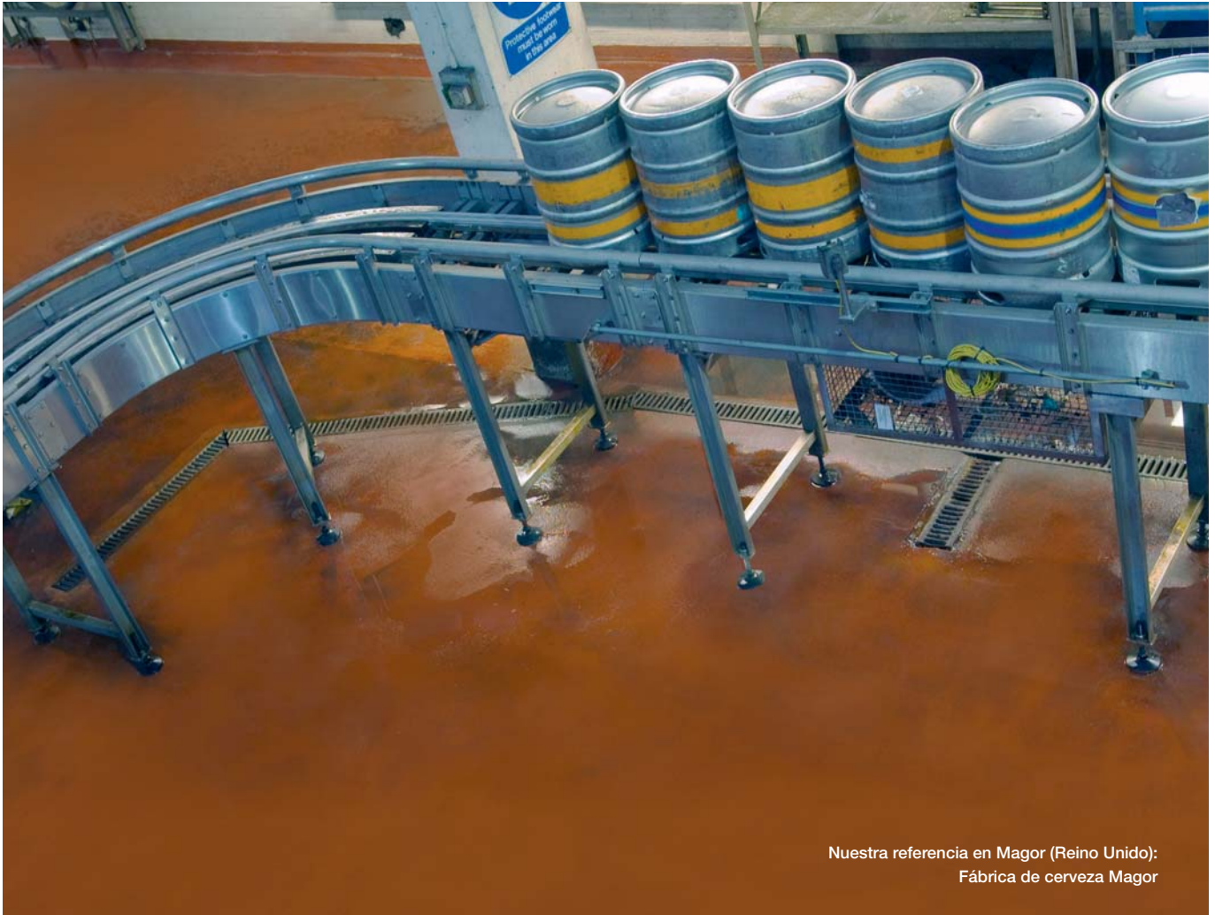
Nuestra referencia en Magor (Reino Unido): Fábrica de cerveza Magor