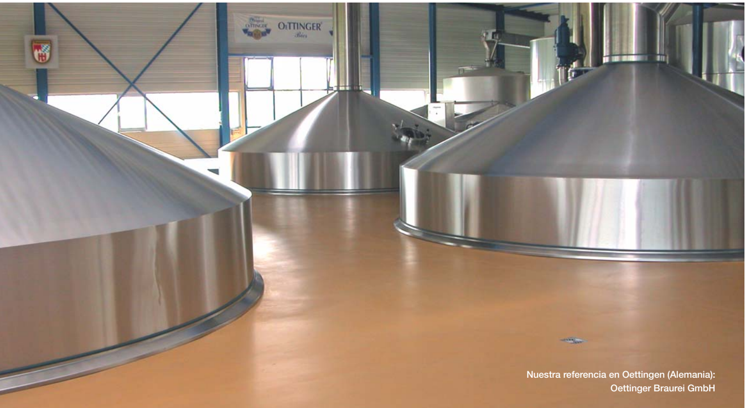
Nuestra referencia en Oettingen (Alemania): Oettinger Brauerei GmbH

Colaborando con las principales compañías en la industria agroalimentaria y específicamente, en la industria dedicada a la fabricación de cerveza, los expertos de Master Builders Solutions de BASF pueden ofrecer soluciones a medida para los requerimientos particulares de nuestros clientes. La gama resultante de productos para la protección de los pavimentos, elimina los tiempos de parada no productivos asociados a sistemas de baja durabilidad. Por otro lado, nuestros productos para la renovación y mantenimiento son fáciles de instalar y curan de forma rápida, asegurando nuevamente un reducido tiempo de parada productiva.