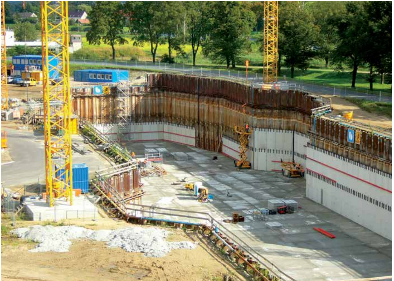
Referenssikohteemme Niederfinowissa Saksassa: veneen noston alusta.