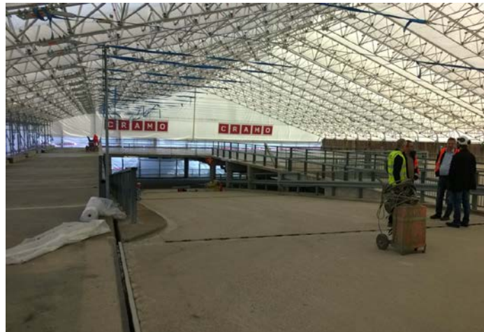
Referenssikohteemme Raisiossa, kauppakeskus Myllyn parkkitilojen korjaustyöt