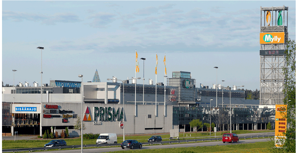
Referenssi kohteemme Raisiossa, kauppakeskus Myllyn parkkitilojen korjaustyöt