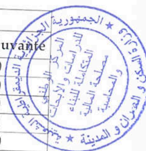
Tableau 2 : Valeurs de consistance mesurées au cône et de réduction d'eau