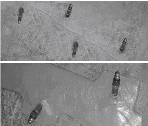
Rys. 1. Iniektory wiercone umieszczone wokół pęknięcia i uszczelnione odpowiednim klejem epoksydowym z serii MasterBrace.

Odessać pył powstały podczas wiercenia i oczyścić otwory. Umieścić iniektory w przygotowanych otworach, wkręcić i mocno zamocować. Aby zapobiec wyciekom żywicy iniekcyjnej z pęknięcia, wszystkie pęknięcia i brzegi iniektorów należy uszczelnić za pomocą szpachelki lub pacy z zastosowaniem jednego z poniższych produktów Master Builders Solutions, zob. rys. 1.