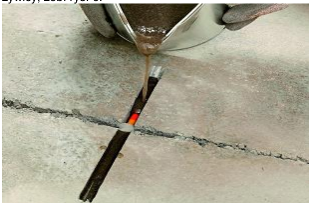
Rys. 6. Wypełnianie kanalików pod ściąg i pęknięć mieszanką MasterInject 1360.

Przygotować mieszankę żywicy MasterInject 1360 i suchego czystego piasku kwarcowego, aby otrzymać płynną zaprawę, którą można wypełniać kanaliki na ściąg. Następnie wlać zaprawę do kanalika, wypełniając go całkowicie. Po wypełnieniu kanalików przystąpić do wylewania samej żywicy MasterInject 1360 w pęknięcia od góry. Odczekać do czasu wniknięcia żywicy w pęknięcie i kontynuować wypełnianie pęknięć, a w razie potrzeby także kanalików, dopóki nie będą już w stanie przyjmować żywicy, zob. rys. 6.