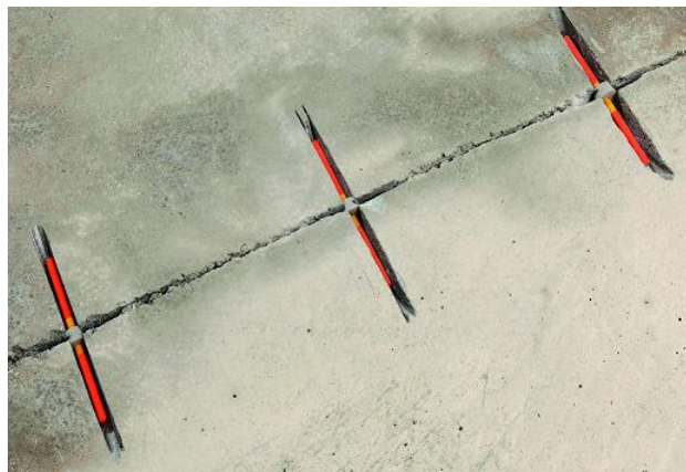
Rys. 3. Rozmieszczenie ściągów w otwartych kanaliku w otwartych pęknięciach.

szczotki drucianej, ręcznej szlifierki lub zastosować metodę piaskowania, aby usunąć z pęknięcia luźne cząstki, oraz usunąć pyły przy pomocy sprężonego powietrza wolnego od oleju. Następnie ostrożnie umieścić ściąg w kanaliku, zob. rys.3.