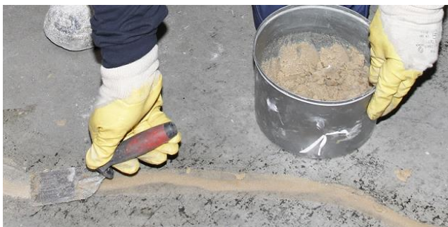
Rys. 5. Wyrównywanie spękanej powierzchni przy pomocy odpowiedniej zaprawy MasterBrace.