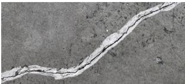
Rys. 2. Bruzda w kształcie litery V w otworze pęknięcia.

Jeżeli beton ma bardzo małą wytrzymałość lub podłoże jest bardzo słabe, należy naciąć pęknięcia, tak aby w otworze pęknięcia utworzyć bruzdę w kształcie litery V, zob. rys. 2.