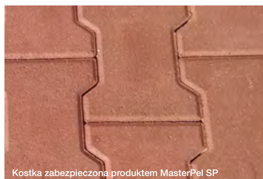
Kostka zabezpieczona produktem MasterPel SP

*Wynik zależy od zastosowanej ilości i interakcji z konkretnym podłożem