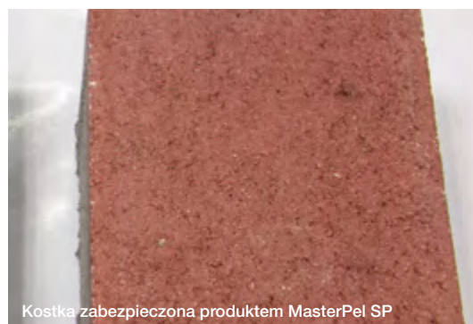
Kostka zabezpieczona produktem MasterPel SP