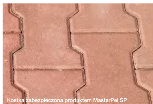
Kostka zabezpieczona produktem MasterPel SP