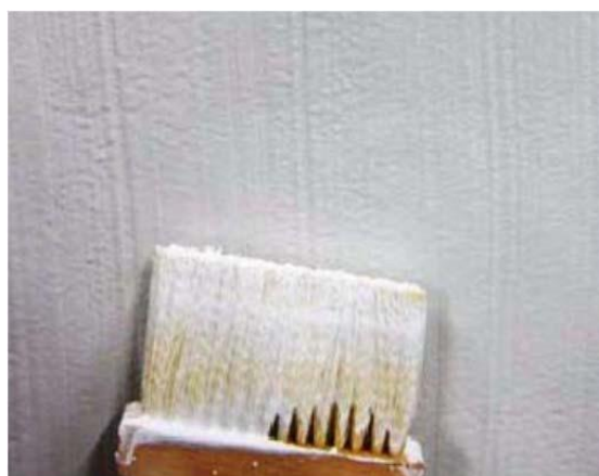
Rys. 1: Nakładanie pędzlem

MasterSeal 6100 FX można nakładać pędzlem, pacą lub wałkiem. Nakładanie wałkiem jest dopuszczalne, przy czym nie jest zalecane.