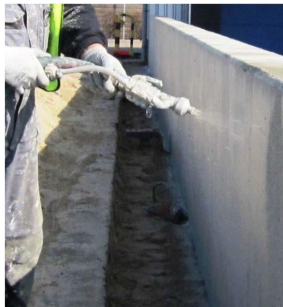
Rys. 2: Aplikacja natryskowa MasterSeal 6100 FX