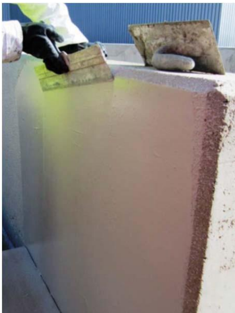
Rys. 3: Wykończenie MasterSeal 6100 FX

Zwilżyć pierwszą powłokę i usunąć nadmiar wilgoci. Nałożyć mieszankę na powierzchnię pędzlem lub szczotką (jak powyżej) posuwając się w przeciwnym kierunku do poprzedniej powłoki.