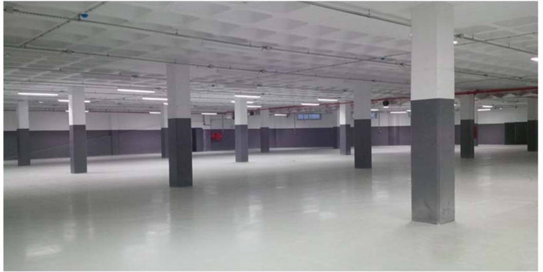
A nossa referência em Oliveira do Bairro (Portugal): Centrauto