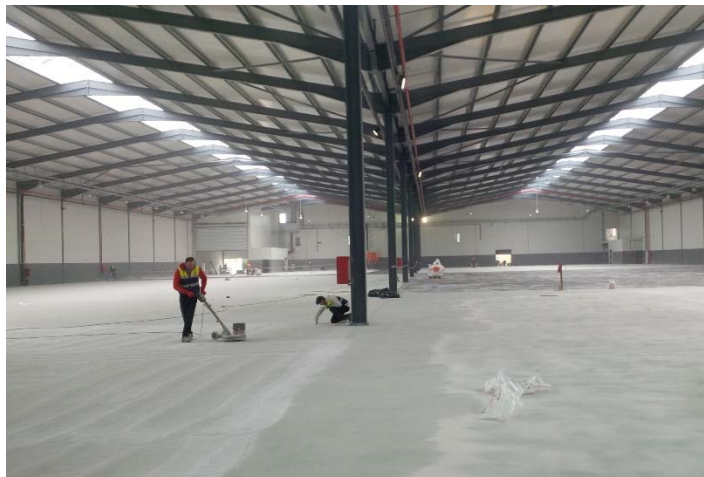
Despolimento da saturação com agregados naturais: Centrauto