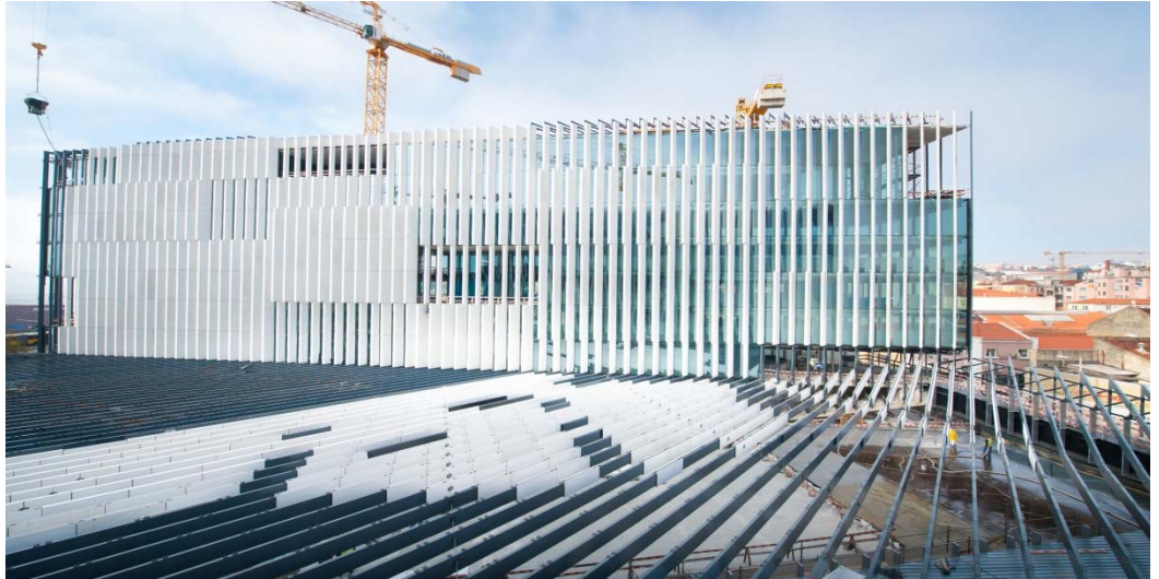
A nossa referência em Lisboa (Portugal): Nova Sede EDP