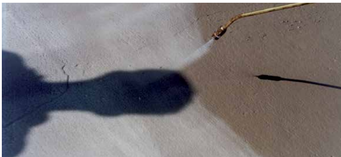
Applicering av MasterKure på byggsplatsen efter läggning av betongen.