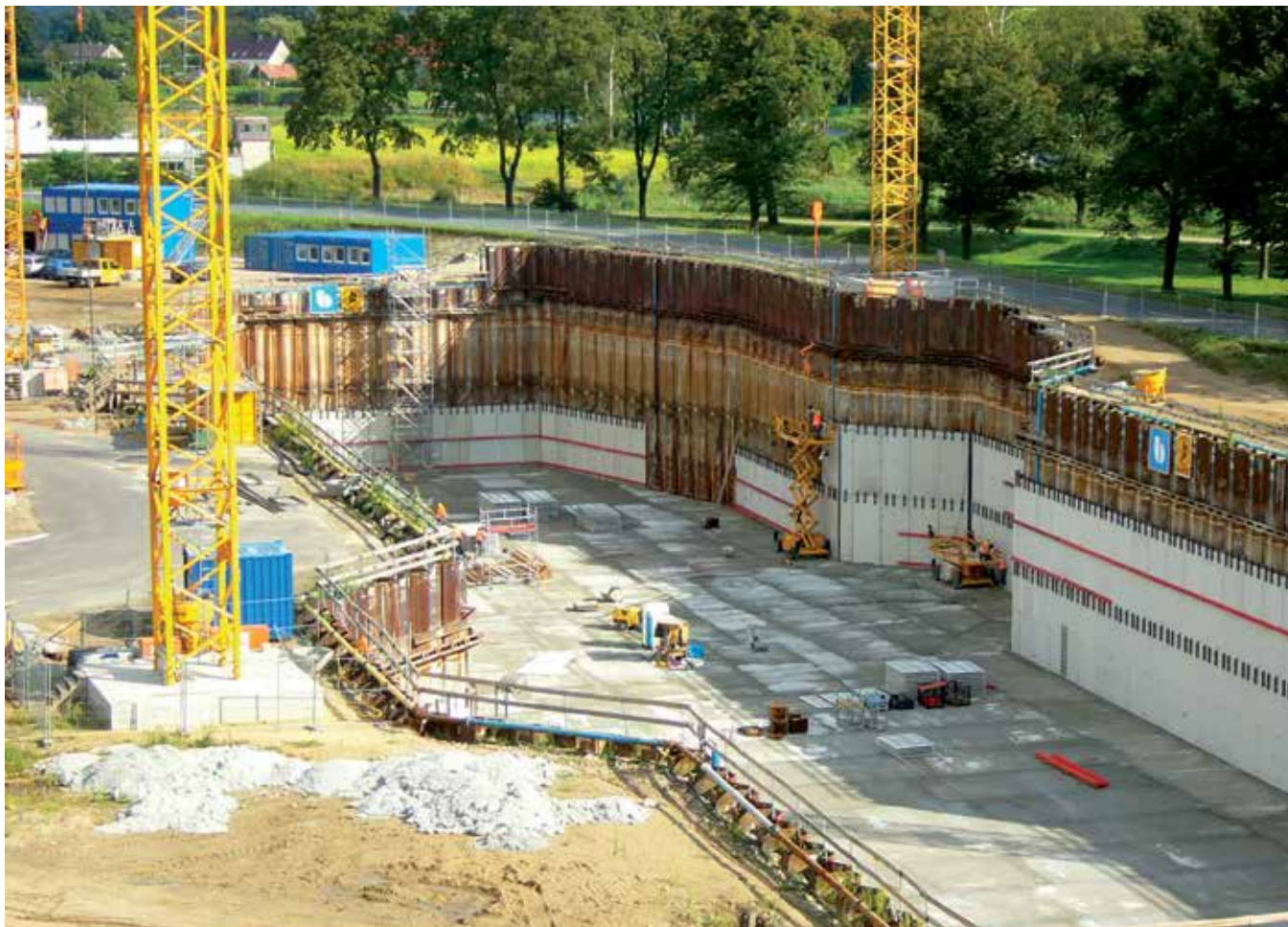
Vår referens i Niederfinow (Tyskland): Fundament till båtlyft.