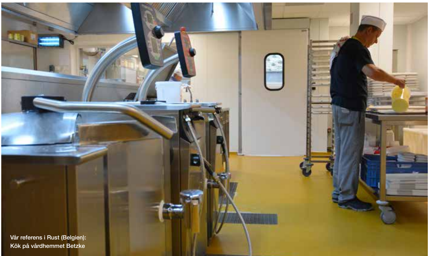
Vår referens i Rust (Belgien): Kök på vårdhemmet Betzke

Ucretegolv utvecklades ursprungligen för att möta kraven inom industrin. De är därför extra slitstarka och stöttåliga, vilket gör att de till exempel inte tar skada av tappade grytor. Samtidigt har Ucretegolv god kemisk resistens och tål citronsyra, ättika, socker och liknande. Golven kan också användas i kyl- och frysrum då de klarar temperaturer ned till -40 °C.