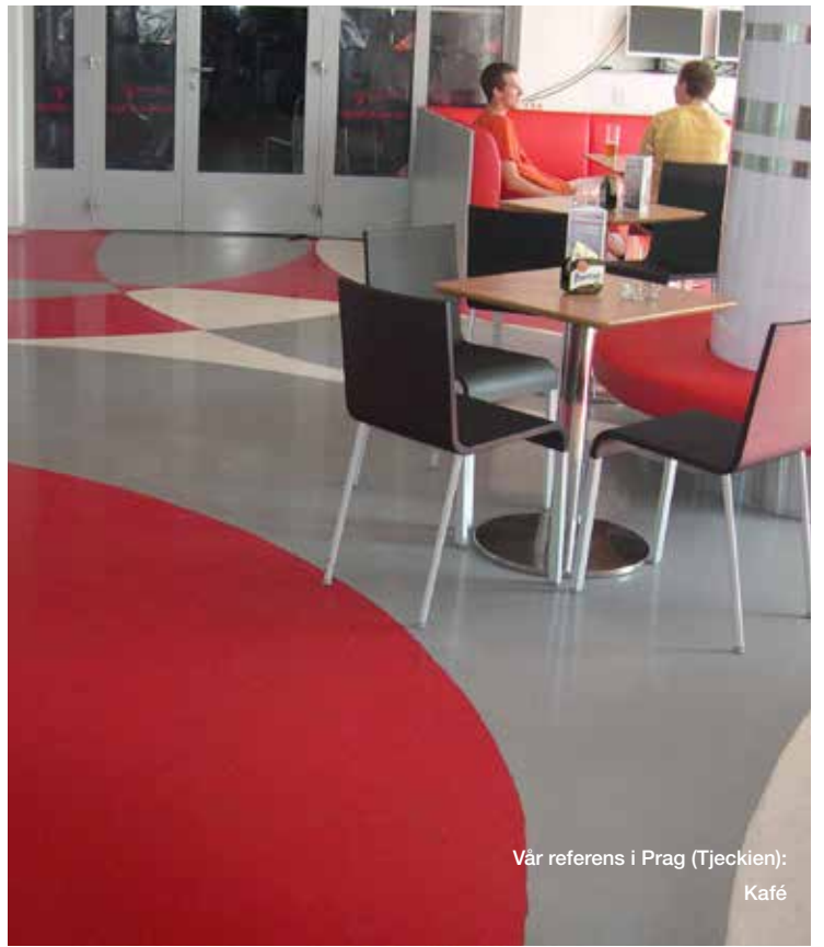
Vår referens i Prag (Tjeckien): Kafé