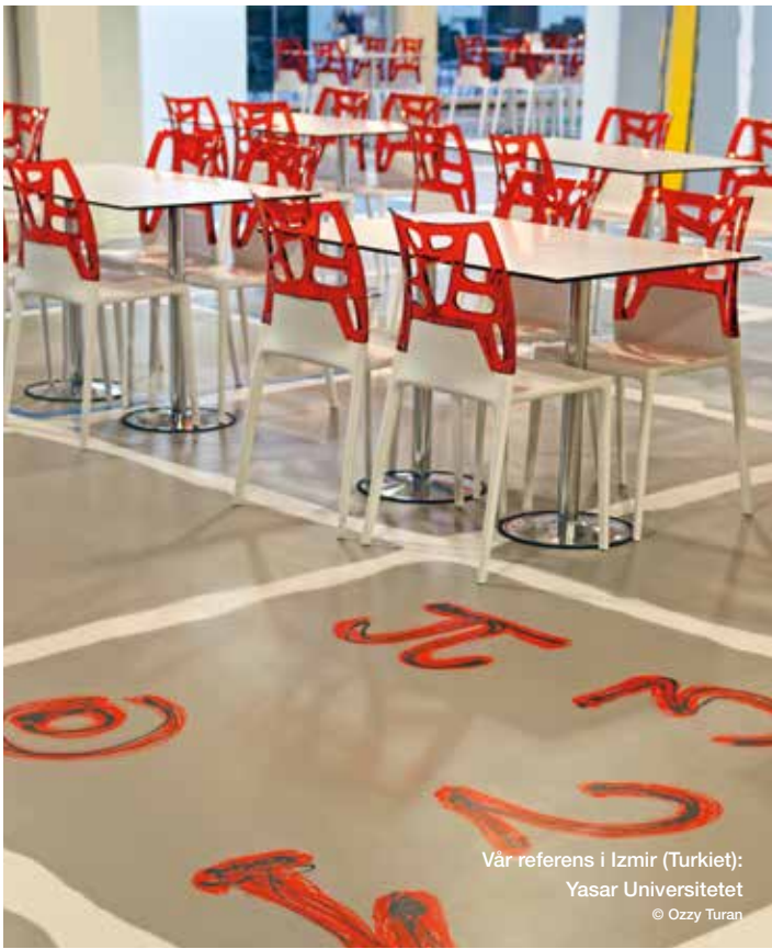
Vår referens i Izmir (Turkiet): Yasar Universitetet