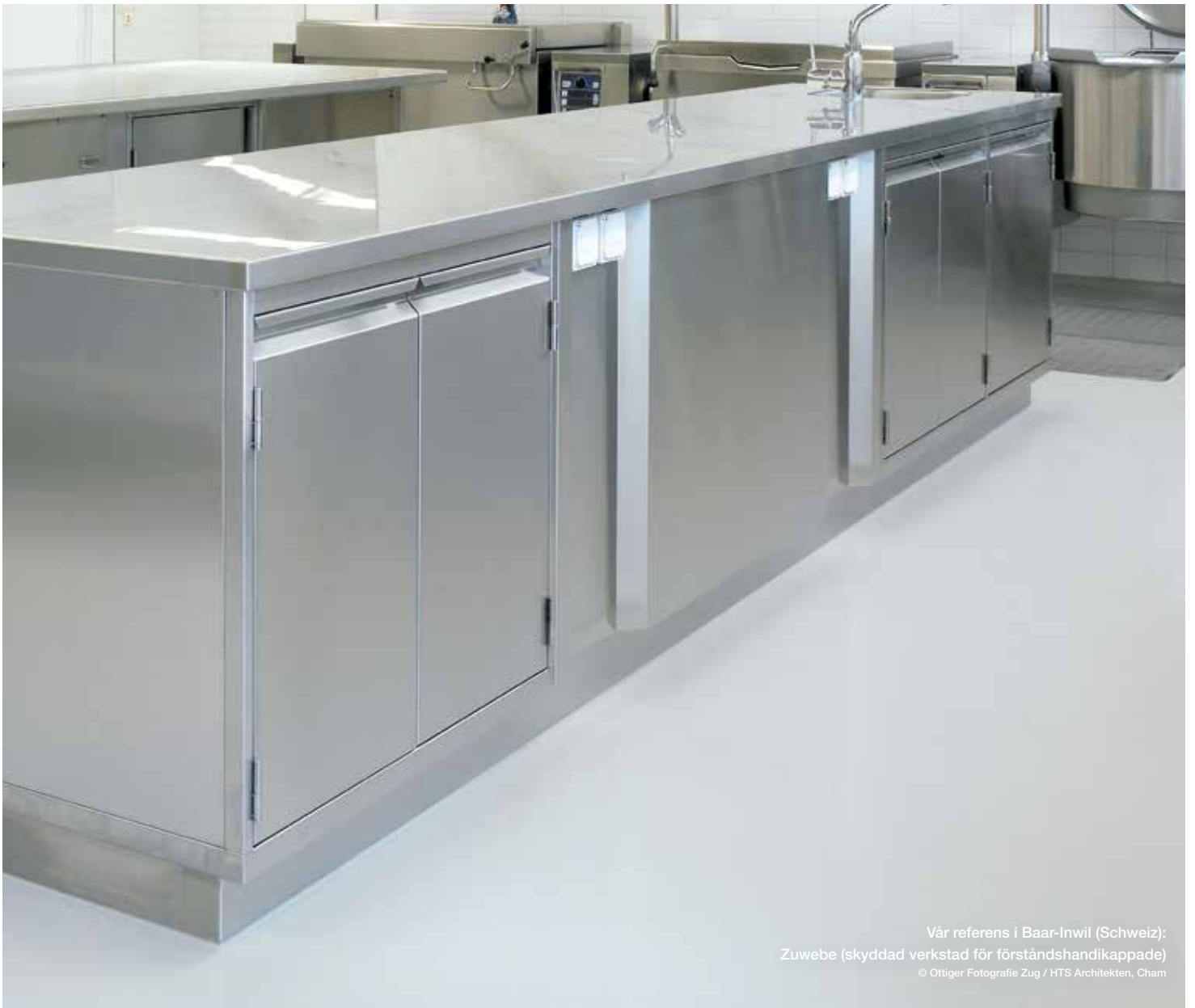
Vår referens i Baar-Inwil (Schweiz): Zuwebe (skyddad verkstad för förståndshandikappade) © Ottiger Fotografie Zug / HTS Architekten, Cham